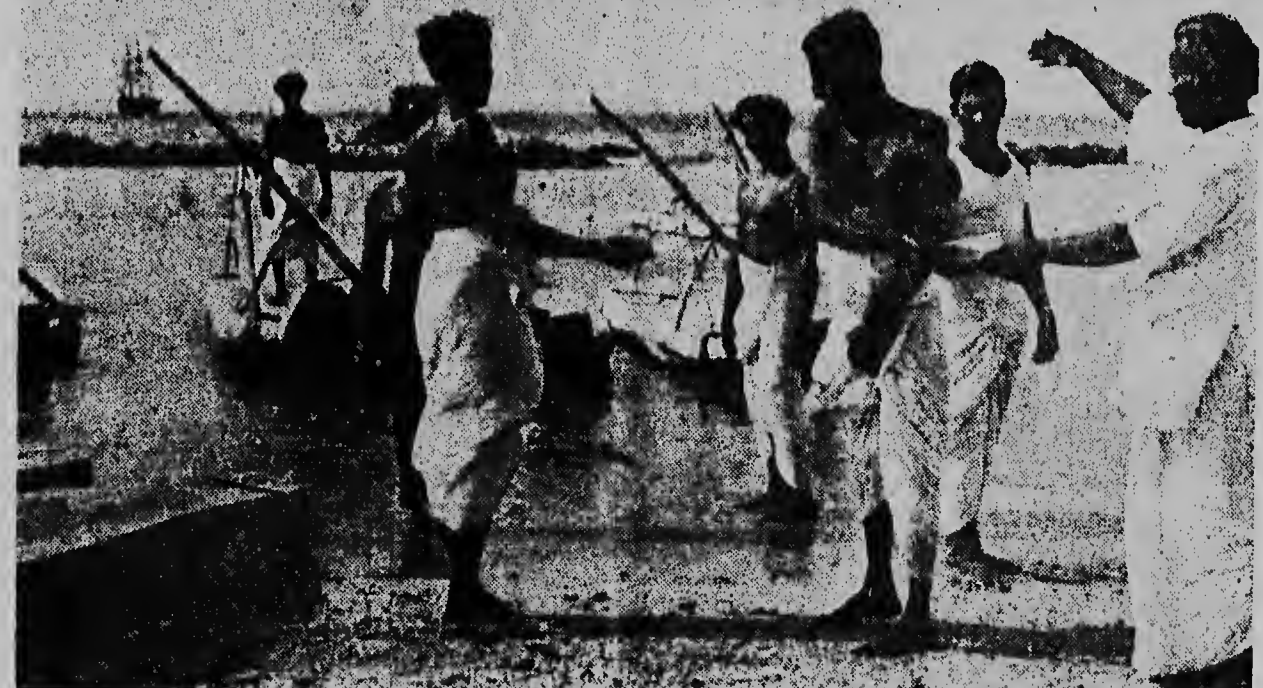
Unesco ta tumando masha Interes den yuda paisnan na tur parti di mundo pa alza nan standard di bida. Un di e proyectonan cu nan ta yudando hopi cune ta yuda e piscadonan tanto cu material y boto como cu conseho y investigacion di e mihor lugarnan pa nan por bal piscu. Aki nos ta welta un grupo di piscado na Ceylon cu tambe ta ricibi ayuda di Unesco cu e mes un obheto.

Het vliegtuig dat via Tripolis van Charleston in Zuid Carolina naar Bahrein vloog, miste bij de landing de rolbaan en vloog in brand. Zesentwintig andere inzittenden zijn er levend af gekomen.